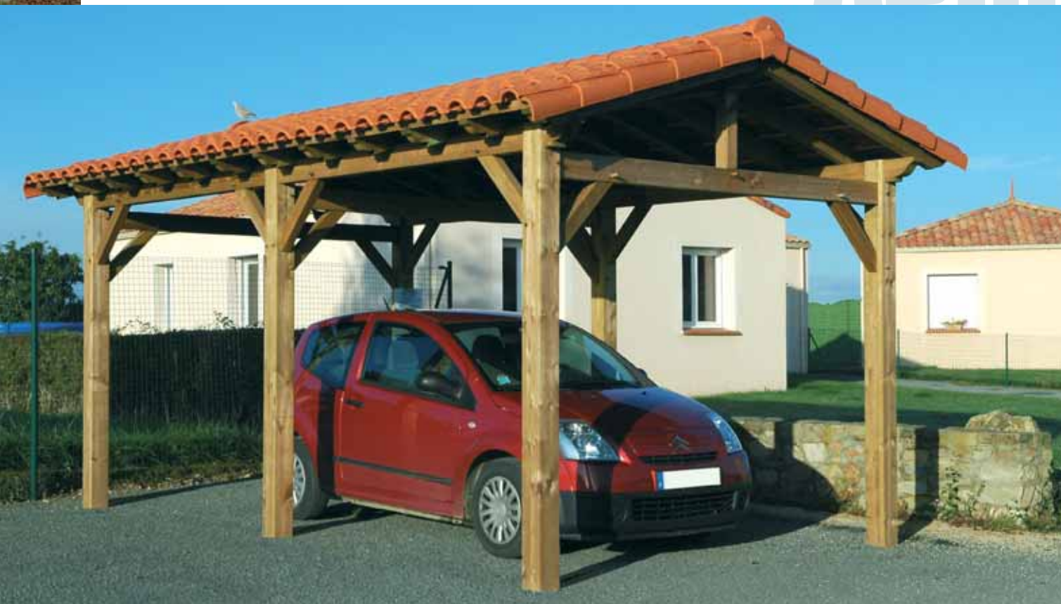
Abri recouvert de tuiles (non fournies)